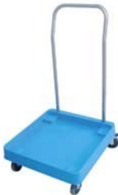
CARRELLO CON MANIGLIA PER TRASPORTO CESTELLI LAVASTOVIGLIE