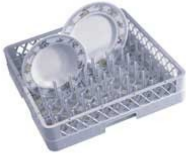
CESTELLO PIATTI PER LAVASTOVIGLIE