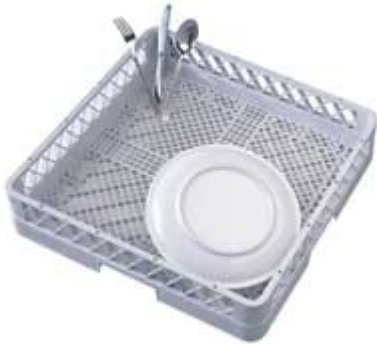
CESTELLO UNIVERSALE PER LAVASTOVIGLIE